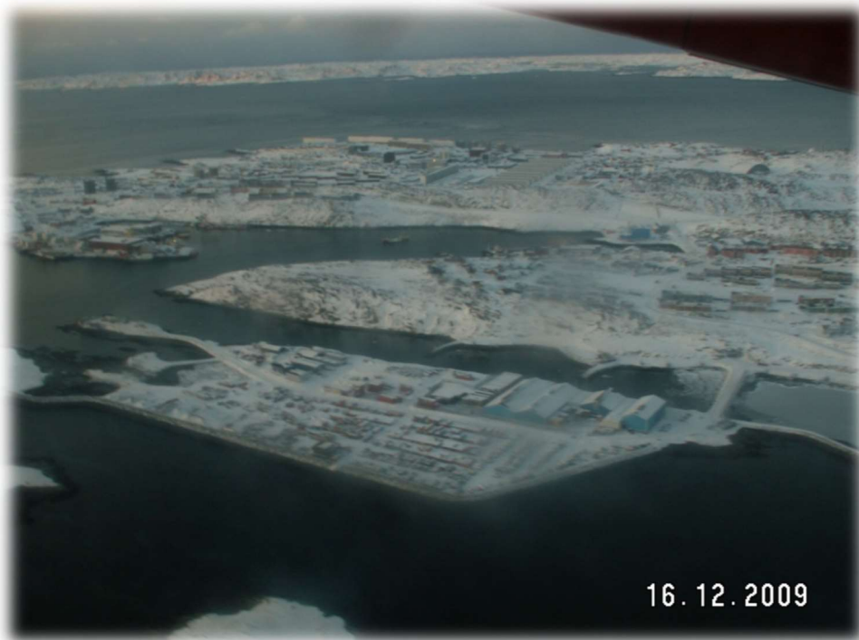
Nuuk fra luften