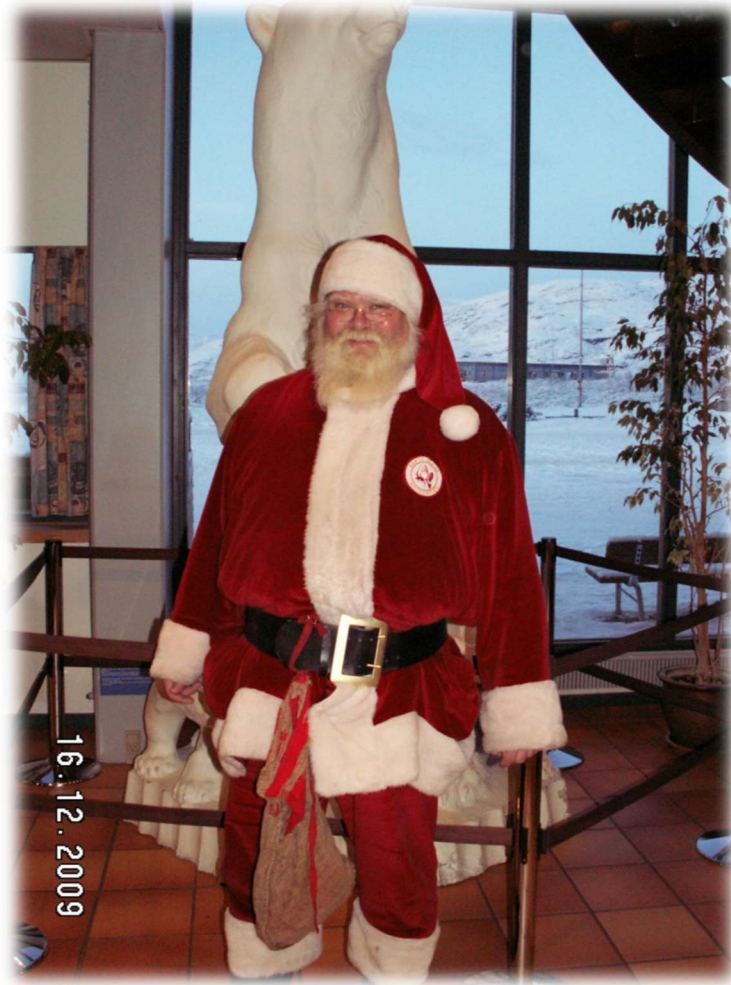
Julemanden skulle flyve tilbage med os til Danmark