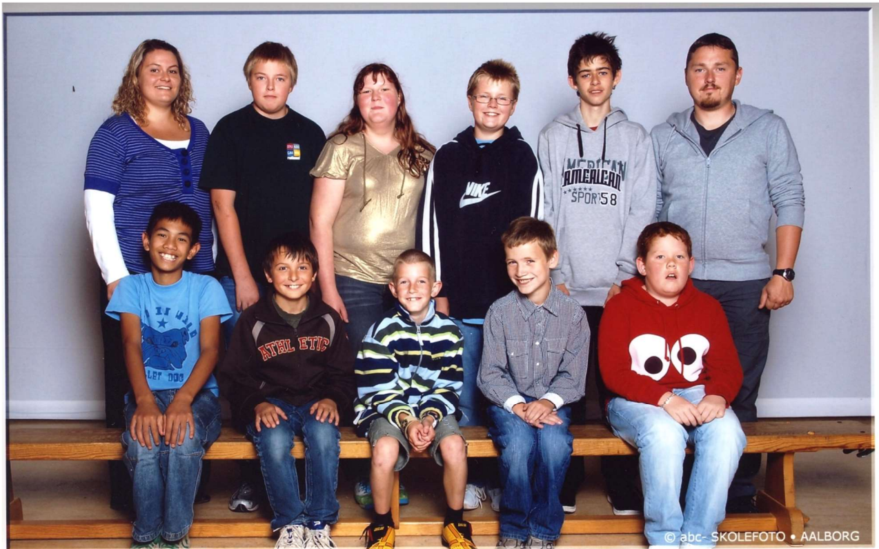
Sønder Felding Skole