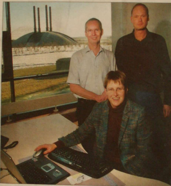
Tanken med Lundberg Datas afdeling i Herning er, at den skal servicere firmaets kunder i Jylland og på Fyn.