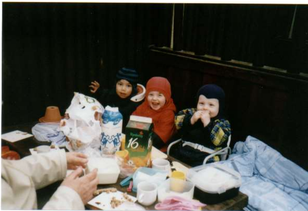
Vi spiser frokost i Haverstrup